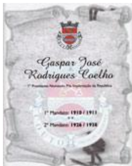
1º PRES. NOMEADO APÓS IMPLANT. REPÚBLICA 1910/1911 E 1926/1938