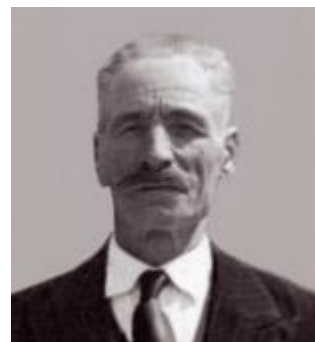
MANUEL JOSÉ DE AMORIM PRES. DA JUNTA - 1917/1918